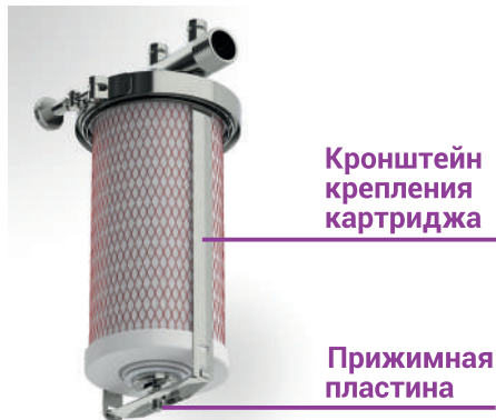
Рис 1. Установка картриджа Арагон 3 в фильтр Гейзер Тайфун

В течение срока службы фильтр не требует специального обслуживания, кроме периодической замены или регенерации установленных картриджей.