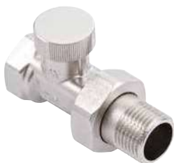
[751-000-07] Вентиль запорный прямой