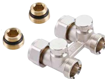
[760-000-07] Набор прямых подключений с радиаторными ниппелями