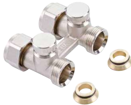
[760-001-07] Набор прямых подключений со втулками для подключения