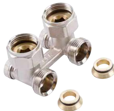
[760-101-07] Набор угловых подключений со втулками для подключения