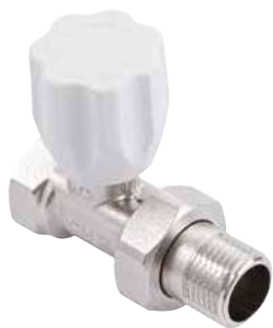
[750-060-15] Вентиль для радиатора прямой

В 2011 Группа Арматура расширила свое предложение и ввела четыре вида современных вентилей. Новинкой являются также наборы прямых и угловых подключений.