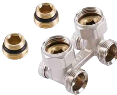
[760-100-07] Набор угловых подключений с радиаторными ниппелями