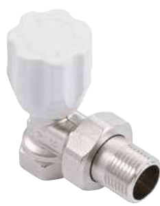
[750-160-15] Вентиль для радиатора угловой