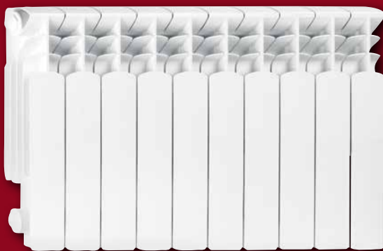
Тип радиатора: G 350 F

Максимальная рабочая температура составляет 95°C Максимальное рабочее давление 16 бар.