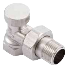
[751-100-07] Вентиль запорный угловой